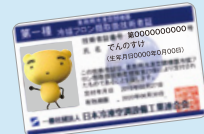
冷媒フロン類 取扱技術者証